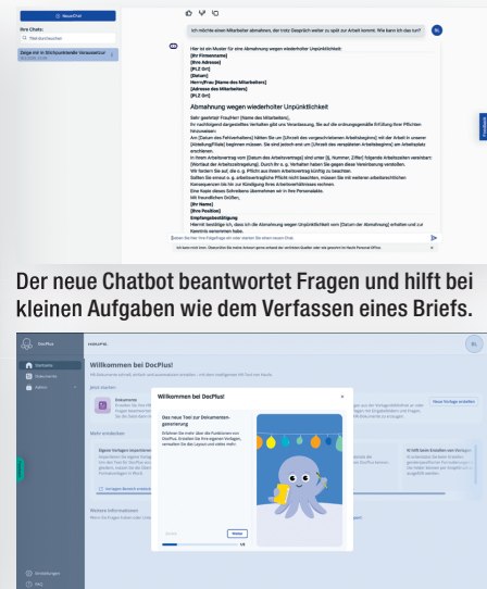
Der neue Chatbot beantwortet Fragen und hilft bei kleinen Aufgaben wie dem Verfassen eines Briefs.