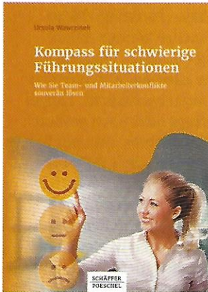
Ursula Wawrzinek: Kompass für schwierige Führungssituationen. Schäffer-Poeschel, 2020, 29,95 Euro